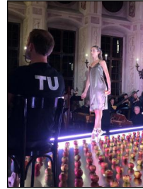
La Pellegrina - Die Macht der Musik – die Florentiner Intermedii von 1589 in Szene gesetzt