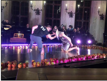
La Pellegrina - Die Macht der Musik – die Florentiner Intermedii von 1589 in Szene gesetzt