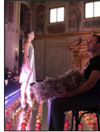
La Pellegrina - Die Macht der Musik – die Florentiner Intermedii von 1589 in Szene gesetzt