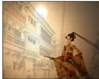
»Madame Butterfly - Sada Yacco Kawakamis Tournee in Übersee« mit dem Taishan Schattenspiel, China 2021, 10 Min. | Regie: Yu, Xiaoyan, Drehbuch: Lin, Yan | Produktion: Munich Dance Histories