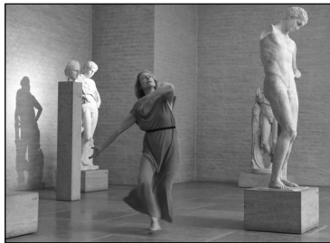
»Isadora Duncan - MOMENT MUSICAL« | München 2021, 2 Min. | Tanz, Interpretation: Elisabeth Schwartz | Filmische Dokumentation: Benedict Mirow © Munich Dance Histories