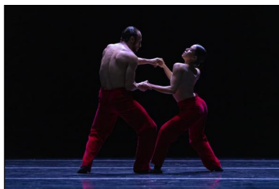
„Woke Up Blind“ von Marco Goecke