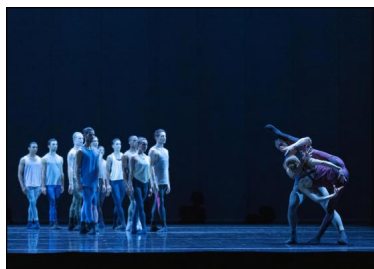
„Metamorphers“ von Jacopo Godani