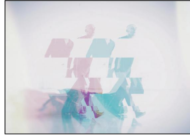
Stephanier Felber: "Apon Paron"