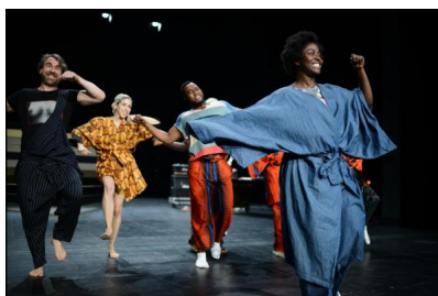
Gintersdorfer Klößen