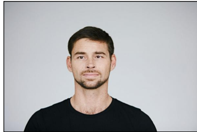
Johannes Härtl © Maciej Schwarz