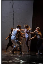
Die Bakchen © Danny Willems