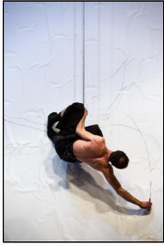
Die Bakchen © Danny Willems