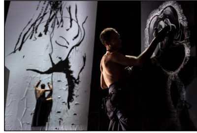
Die Bakchen