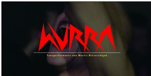
HURRA von Moritz Ostruschnjak

Eine Veranstaltung von Moritz Ostruschnjak. Gefördert durch das Kulturreferat der Landeshauptstadt München und durch den BLZT, Bayerischer Landesverband für zeitgenössischen Tanz, aus Mitteln des Bayerischen Staatsministeriums für Bildung und Kultus, Wissenschaft und Kunst. Realisiert durch eine Residency des Theater Freiburg. Mit freundlicher Unterstützung durch Stage Axis. Moritz Ostruschnjak ist Mitglied des Tanztendenz München e.V.