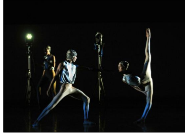
BJBW mit "DisTanz"