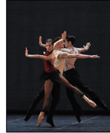
BJBW mit "3 Preludes"