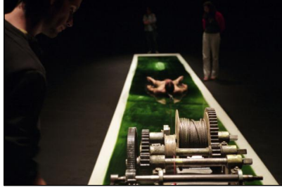
Yann Marussich © Marussich