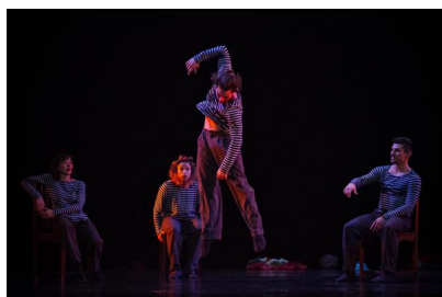
Balé Teatro Guaira

Am 5. & 6. Dezember 2017 um 20:30 Uhr in Schwere Reiter, München