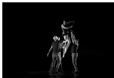
Balé Teatro Guaira © Cayo Vieira