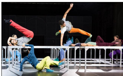
FRANKFURT DIARIES. Choreografie William Forsythe. Ballett des Staatstheaters am Gärtnerplatz

Für Forsythe war diese Hindernis-Choreografie sicher ein fruchtbares Experiment, für Tänzer ist sie eine hochgradige Präzisionsschule, für den Zuschauer ein nervenkitzelndes Erlebnis. Ob es wirklich Tanz ist und nicht nur mathematische Artistik, bleibt die Frage.