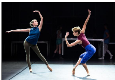
FRANKFURT DIARIES. Choreografie William Forsythe. Ballett des Staatstheaters am Gärtnerplatz