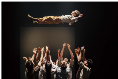
Hofesh Shechter "Grand Finale" in der Muffathalle München