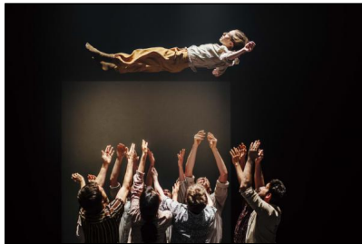
Hofesh Shechter "Grand Finale" in der Muffathalle München